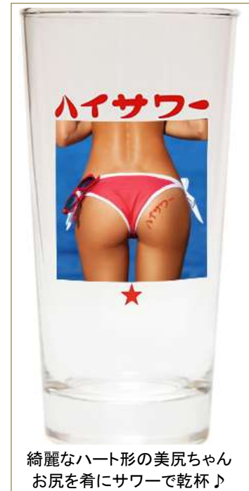
綺麗なハート形の美尻ちゃん お尻を着にサワーで乾杯♪

今回制作した「美尻グラス」は、当社の「ハイサー」や「ハイッピー」、 「ハイサー缶 レモンチューハイ」などの商品とセットにして販売し、税込 1684 円からのお手軽価格でご購入いただけます。